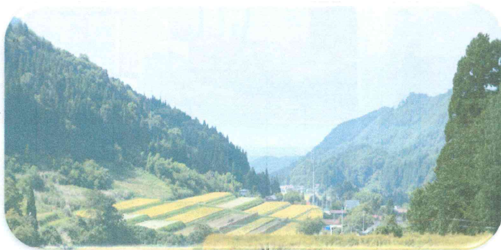
前方が当地区の棚田です！